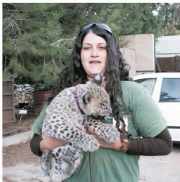
סיון ו"ר"ר הנמר